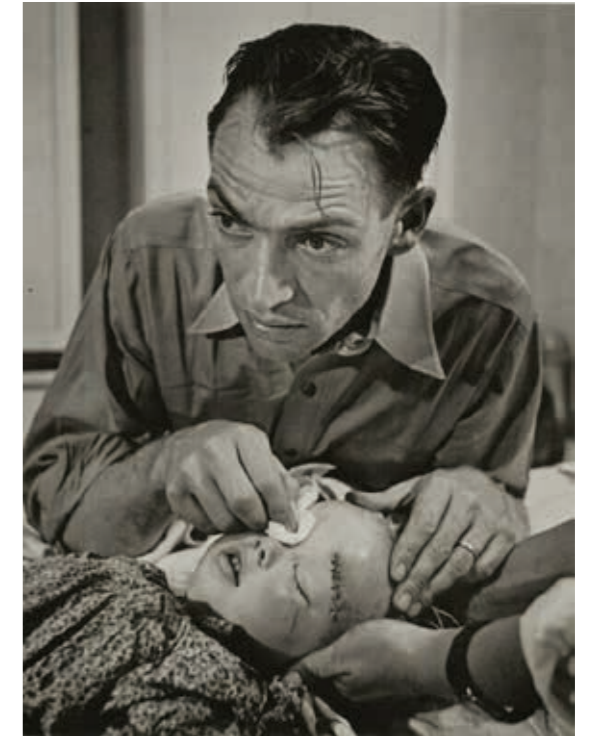
Eugene Smith'in Taşra Doktoru adlı fotoğrafı